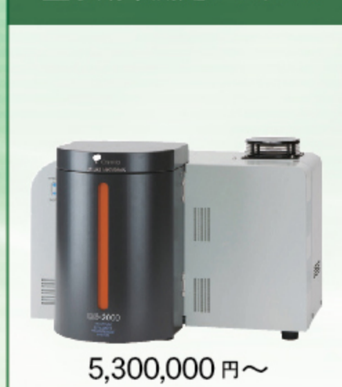
量子効率測定システム