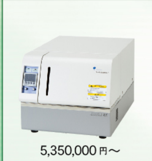
濃厚系粒径アナライザー