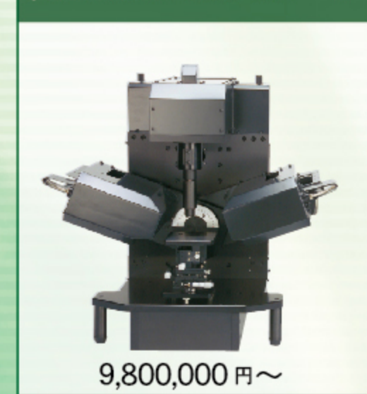
卓上型分光エリプソメータ