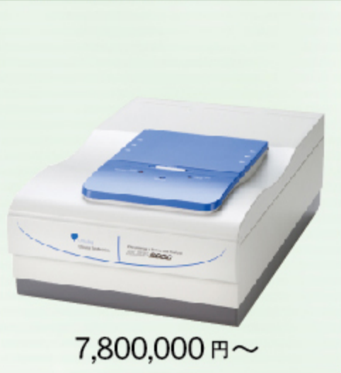
ゼータ電位・粒径・ 分子量測定システム