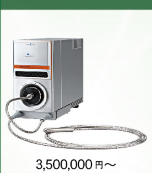
マルチチャンネル分光器