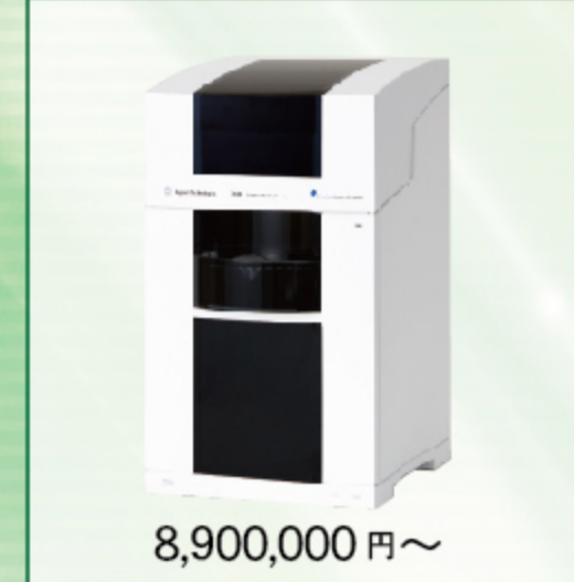
キャピラリ電気泳動システム