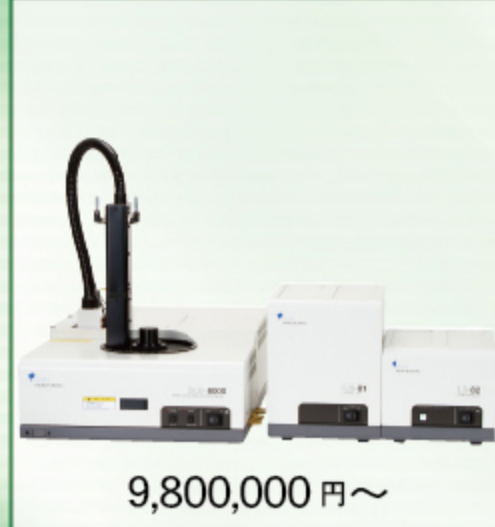
ダイナミック光散乱光度計